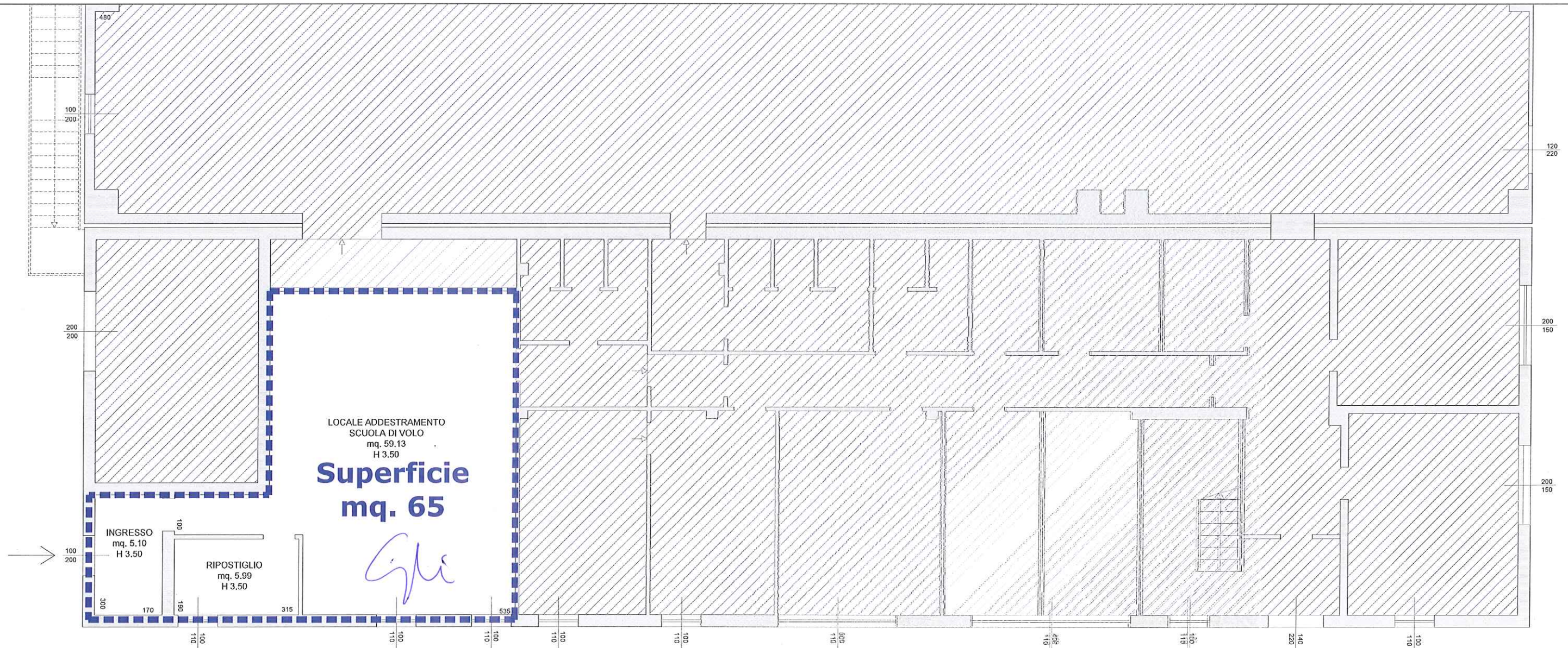
Superficie oggetto di subconcessione _Scala 1:100